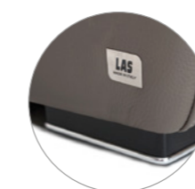
PIEDINO WENGHÈ Wenge foot Fuß aus Wenghè

Vi preghiamo di specificare, all'interno dell'ordine, la tipologia di piedino desiderato.