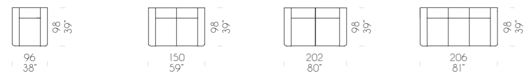
Poltrona Armchair Sessel Divano 2P 2S sofa Sofa 2-Sitzer Divano 3P/2C 3S/2C sofa Sofa 3-Sitzer/2 Sitzkissen Divano 3P/3C 3S/3C sofa Sofa 3-Sitzer/3 Sitzkissen